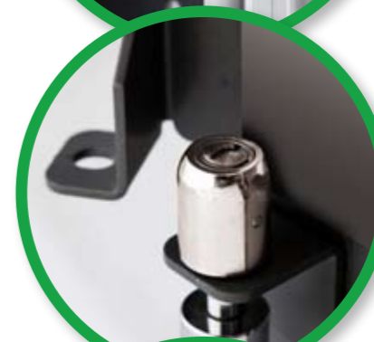
Extra armour plating kit.