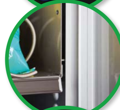
Trays locking system detail.