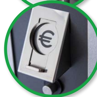
Vandal-proof coin introduction.

Introduction des monnaies anti-vandalisme.