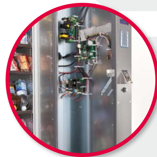
Extractable control panel. Panneau de contrôle amovible.