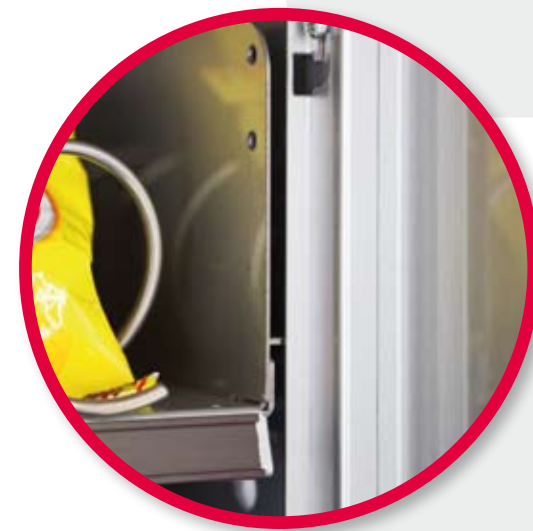
Trays locking system detail. Détail du système de blocage plateaux.