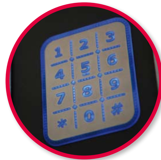
Alphanumeric antivandalism keypad. Clavier alphanumérique antivandalisme.

1 plateau canettes (6 sélections / 36 produits) 2 plateaux bouteilles PET 0,5 l (6 sélections / 36 produits) 3 plateaux snacks (15 sélections / 177 produits)